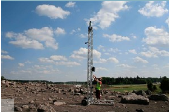
Dokumentation einer Ausgrabung per 3-D-Laserscanner in Schweden.