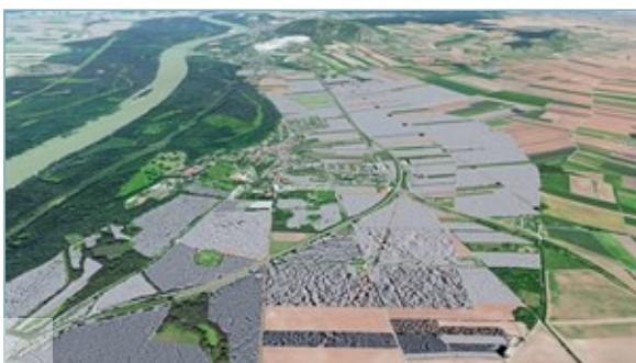
Großflächige geophysikalische Prospektion in Carnuntum, Niederösterreich.

Hilfsmittel wie Laserscanner und Drohnen machen Verborgenes sichtbar. Archäologie ohne Ausgrabung mag wie Nationalmannschaft ohne Alaba klingen – ist es aber nicht