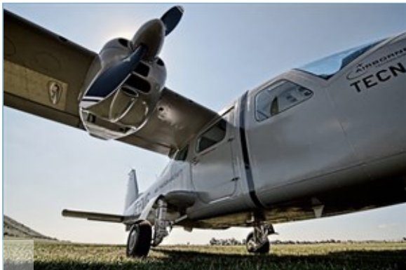
Flugzeug ausgerüstet mit Laserscanner und Hyperspektralscanner.