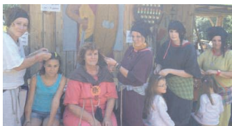
Bunt, flippig und cool: die Fezi Pezi-Haarstylistinnen.

SCHWARZENBACH. Am Freitag, 21. Juni, wird das Fezi Pezi-Team ganztägig am Keltenfest zugange sein. Die kreativen Stylistinnen kreieren direkt vor Ort am Festgelände am Keltenberg bunte geflochtene Keltenzöpfe. Vorbeischaun lohnt sich. WERBUNG