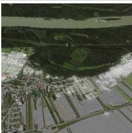
Überischt der geomagnetischen Prospektion im Gebiet des römischen Carnuntum.

Beinahe die gesamte römische Stadt, die einst über 10 km 2 bedeckte, ist heute noch unter den Feldern und Weingärten der Orte Petronell-Carnuntum und Bad Deutsch-Altenburg erhalten. Im Rahmen des Projektes »Gesamtprospektion Kernzone Carnuntum« wurde das Areal vom Ludwig Boltzmann Institut für Archäologische Prospektion und Virtuelle Archäologie (LBI ArchPro) in enger Zusammenarbeit mit der Zentralanstalt für Meteorologie und Geodynamik und dem Institut für Kulturgeschichte der Antike der Österreichischen Akademie der Wissenschaften mit Magnetfeldsensoren und Bodenradar durchleuchtet. Derzeit wird der riesige Datensatz wissenschaftlich ausgewertet.