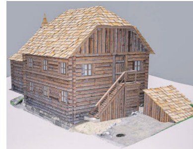
Die Rekonstruktion.

deutet, dass die damalige Volksseeche Syphilis damit behandelt wurde. Sensationell war für die Forscher die Entdeckung von zwei Kellerräumen unter der Klausen. Diente der eine Gewölbekeller als Vorratsraum, hatte der zweite Keller eine einzigartige Funktion: Dort mündete eine hölzerne Leitung, aus der Wasser in die „Wolfgangiflascher!“ abgefüllt wurde. Scherbenfunde zeugen von der Beliebtheit dieses Andenkens unter den Wallfahrern. Gespeist wird sie vermutlich aus der ursprünglichen Quelle auf dem Falkenstein, die der Legende nach vom heiligen Wolfgang mit seinem Stab für seinen dürstenden Mitbruder aus dem Felsen geschlagen wurde. Der Legende nach weilte der heilige Wolfgang selbst als Eremit im zehnten Jahrhundert an diesem Ort.