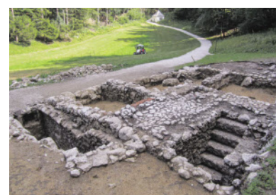
Die steinernen Überreste.